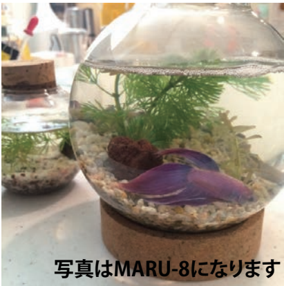
写真はMARU-8になります