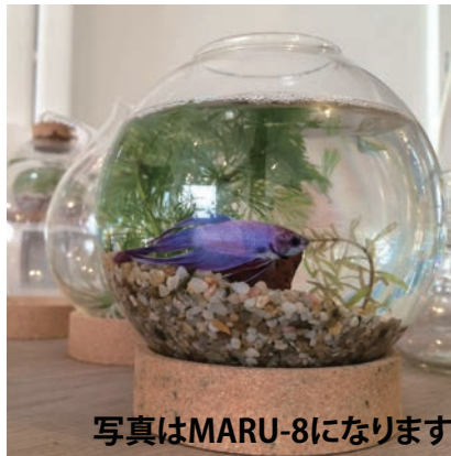
写真はMARU-8になります